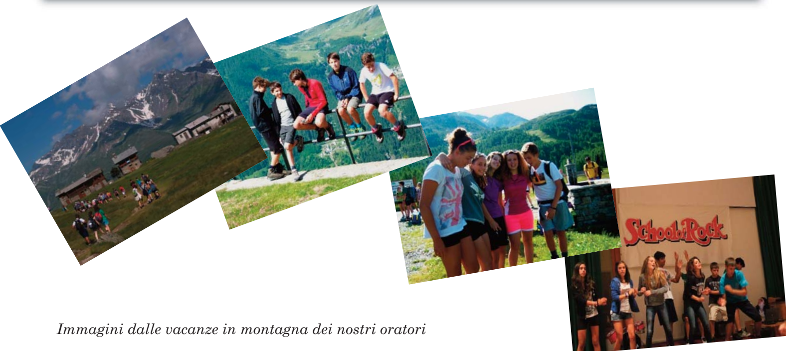
Immagini dalle vacanze in montagna dei nostri oratori